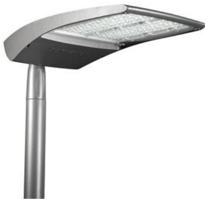
Abb.: Schreder TECEO

Für Brückenbereich und Rampe, Seite Sinzing